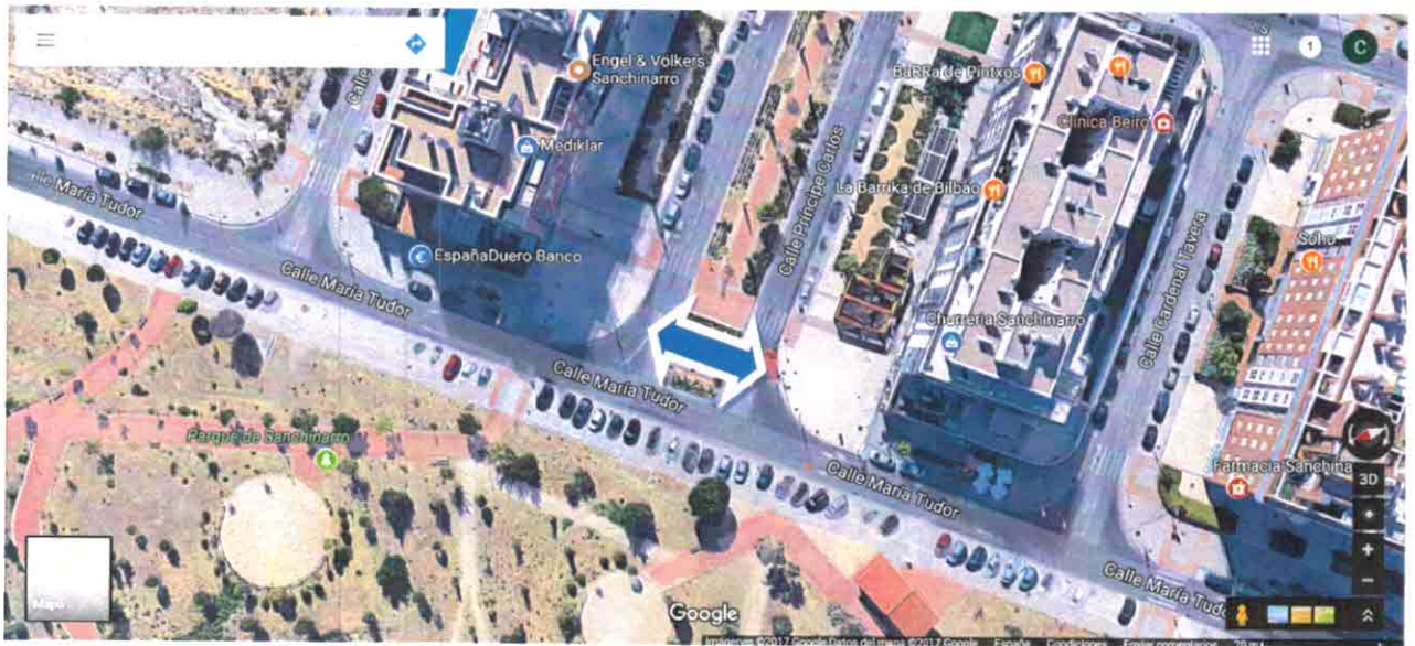
Propuesta de emplazamiento para el cambio de sentido.