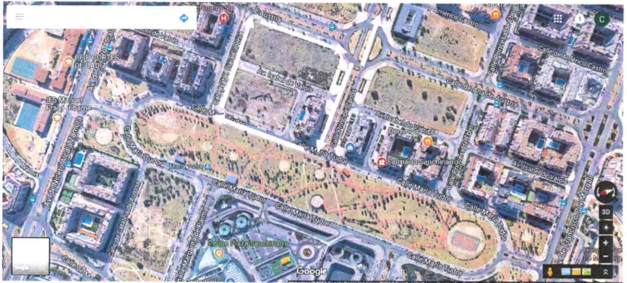
Situación actual. Recorrido necesario para hacer el cambio de sentido.